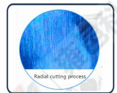
Proceso de corte radial