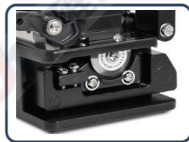
Pulido y hendido en 1 máquina.