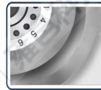
Acero de tungsteno de alta calidad