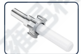
Virola de cerámica