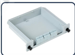
Carcasa de plástico ABS