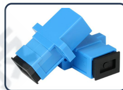
Baja pérdida y buena repetibilidad.