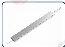
Chips de alta calidad